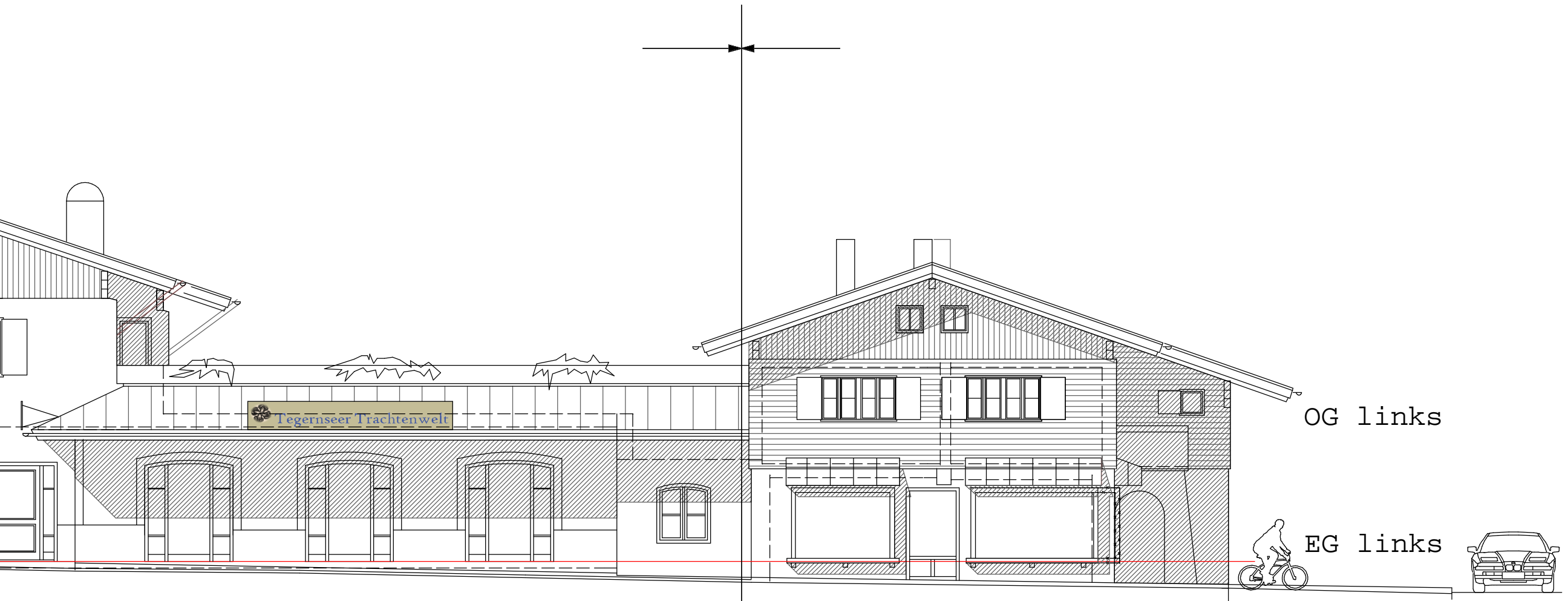
Gebäudeteil B Gebäudeteil A